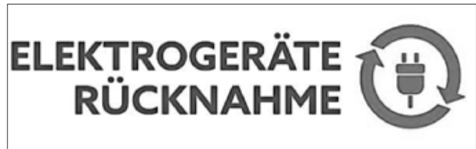
Am Logo „Elektrogeräte Rücknahme“ sind die neuen Sammelstellen erkennbar Grafik: Plan E

Kleingeräte wie Bildschirme, Lampen oder elektrische Zahnbürsten sowie Batterien und Akkus werden nach der Abgabe von geschultem Personal fachgerecht in die Sammelbehälter sortiert, was eine präzisere Trennung und höhere Recyclingqualität ermöglichen soll. Bürger sollten die Akkus oder Batterien vorher entnehmen und beides getrennt abgeben. Besonders bei Lithium-Ionen-Akkus und -Batterien sollten die Pole mit Klebeband abgeklebt werden, um Reaktionen während des Transports zu vermeiden und das Brandrisiko weiter zu senken.