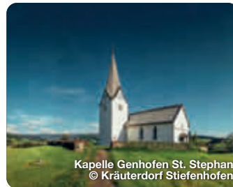
Kapelle Genhofen St. Stephan

Den Wald aus der Vogelperspektive genießen? Vom bis zu 40 Meter hohen, barrierefreien Baumwipfelpfad „Skywalk“ warten faszinierende Ausblicke auf die Allgäuer Bergwelt und den funkelnden Bodensee, sowie spannende Einblicke in den Kosmos Wald. Oberschwenden 25, Scheidegg