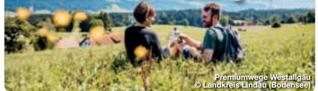
Premiumwege Westallgäu

Das Westallgäu ist eine wunderschöne Voralpenlandschaft, die zum Wandern und Erkunden einlädt. Die Region bietet auf ihren zertifizierten aussichtsreich Premiumwanderwegen über 65 Wanderkilometer, die vorbei an rauschenden Gewässern, zu weiten Ausichten und durch die Kühle des Waldes führen. Hinter jeder Kurve der Wander- und Spazierwege entdeckt man ein neues Naturerlebnis. Eine Besonderheit, die auch das Deutsche Wanderinstitut davon überzeugt hat, die sieben Wandertouren für ihre hohe Erlebnisqualität auszuzeichnen. Jeder der 3 Premium-Wanderwege und 4 Premium-Spazierwanderwege im Westallgäu hat