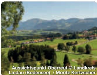
Aussichtspunkt Oberreit