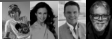
Mickie Krause, Anita Hofmann, Stefan Mross und Wolfgang Trepper