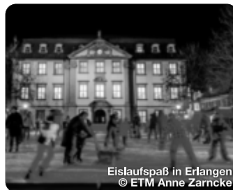
Eislaufspaß in Erlangen

23.11. - 22.12.2024, Aschaffenburg Vor der imposanten Kulisse von Schloss Johannisburg findet der Aschaffener Weihnachtsmarkt statt.